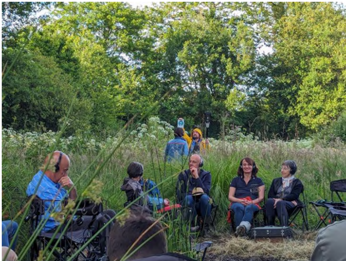
Ici et maintenant, La Corbélière une oasis de biodiversité / L'Agence de géographie affective. juin 2024

Scène Convenue d'Intérêt National-mention Art en Territoire depuis 2021